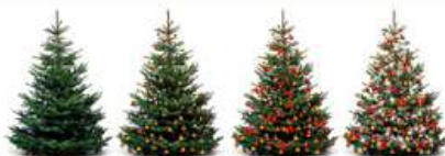
Albero vero, addobbato